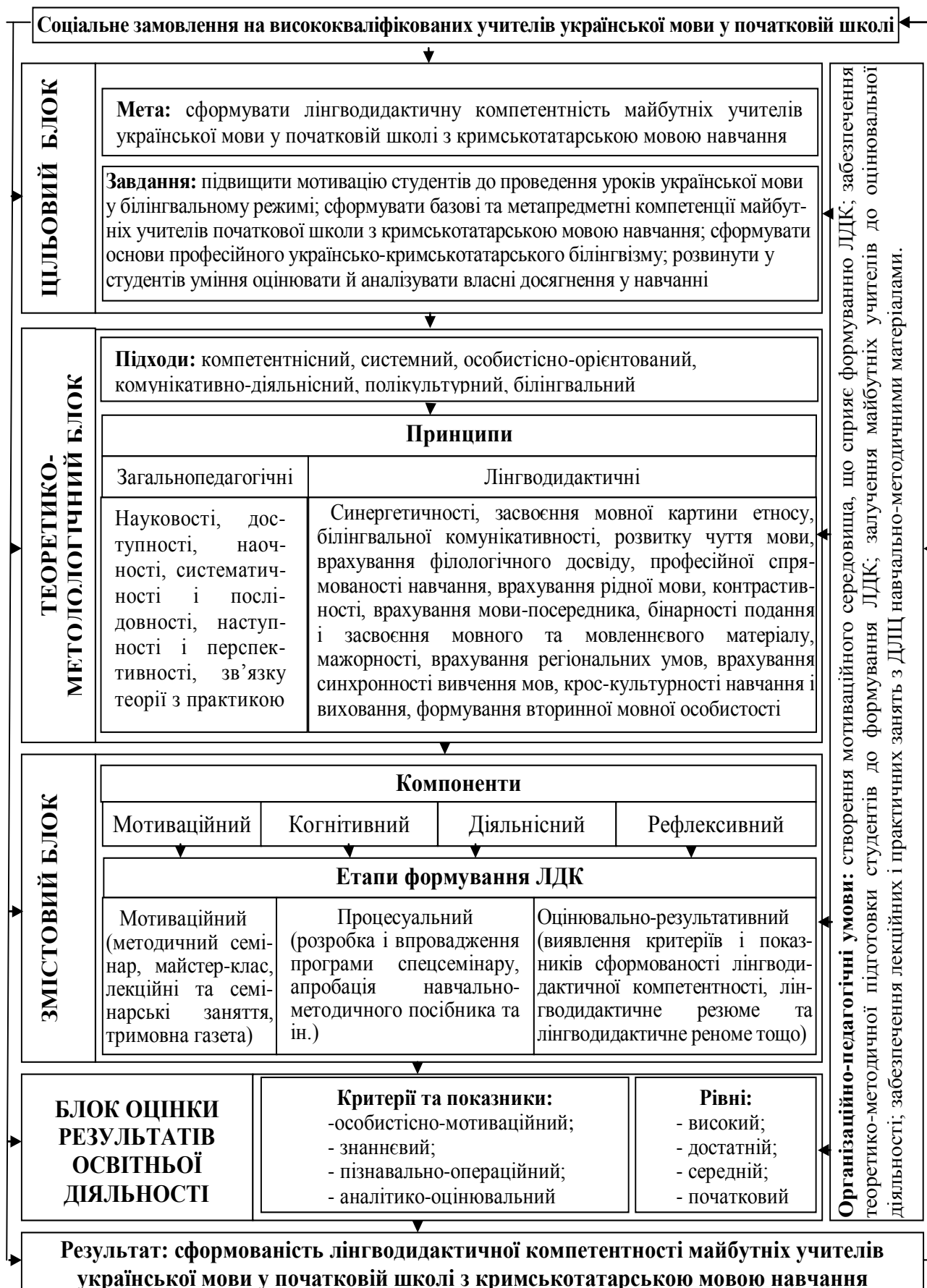
Рис.1. Модель формування лінгводидактичної компетентності майбутніх учителів української мови у початковій школі з кримськотатарською мовою навчання